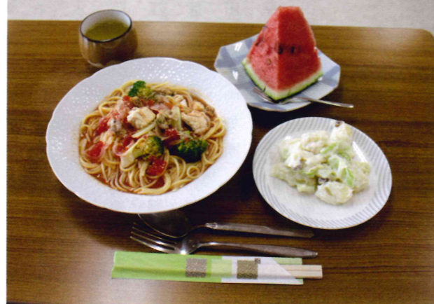
～ 今日のような薄味で健康に気を付けます！ おいしかった～