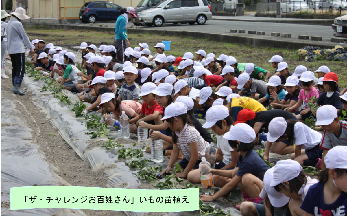
「ザ・チャレンジお百姓さん」いもの苗植え