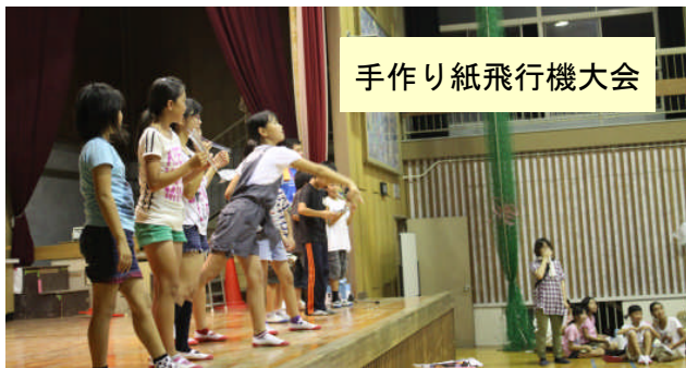
手作り紙飛行機大会

ナイトプールは、いつもの時とちがい、うす暗くてとても楽しかったです。…キッズフェスティバルのお手伝いをされた方、ありがとうございました。(6年女子)