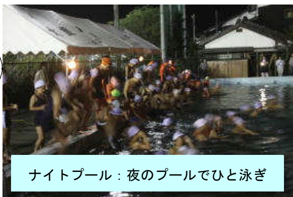
ナイトプール：夜のプールでひと泳ぎ

塩あめにたどり着くまで遠回りをしてしまったので、とても恋しく思いました(笑)。(6年女子)