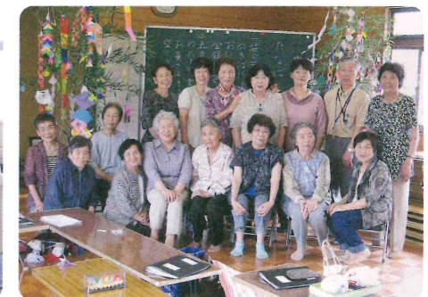
岩富ちよるるの会