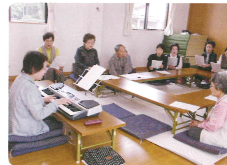
下湯田ひだまりの会