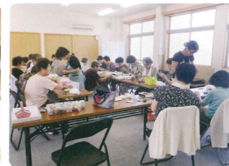
中矢原あつまるう会