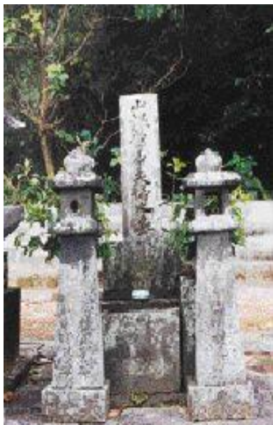
萩市前小畑にある山根孝中の墓