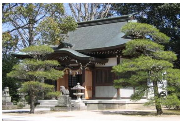
萩市椿東の松陰神社境内の松門神社