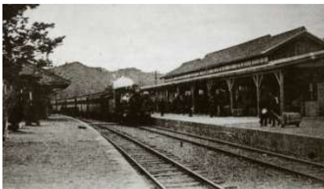
明治末年、小郡駅構内