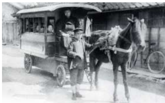
明治末期、乗合馬車