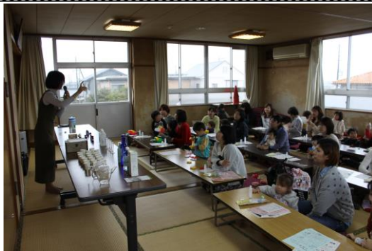
3/18 楽しく子育てみんなの広場 「アロマテラピー」