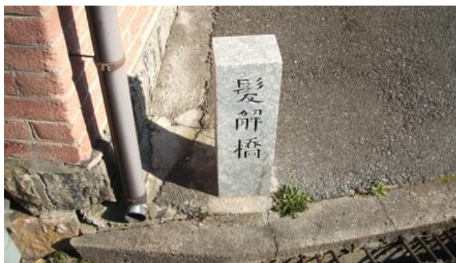
秋穂漁港の近くにある髪解橋の石碑

陶峠 たお 下にある秋穂街道の一里塚。石を積み上げて造られています。現在、この一里塚のみが残存します。