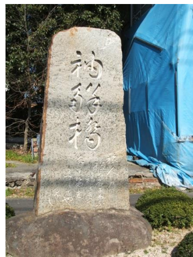
中園町にある袖解橋石碑