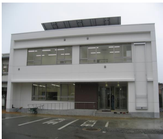
工事完了後の交流センター