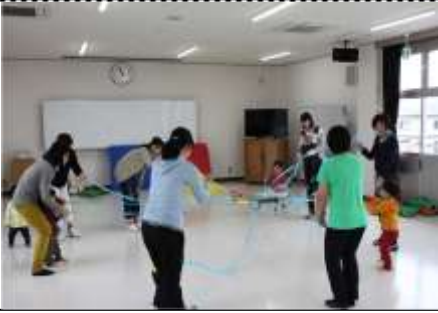
3/13 子育てみんなの広場 親子3B体操