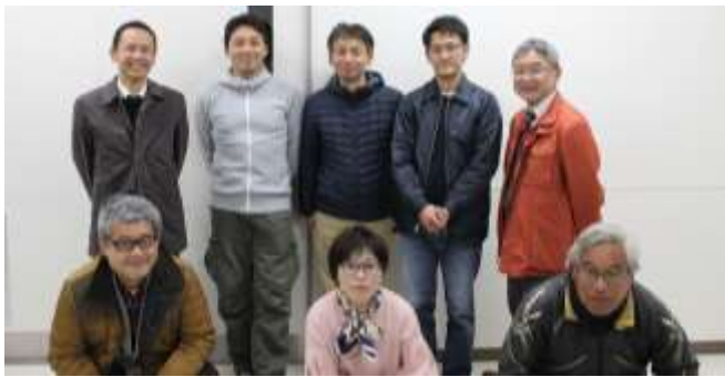
おまつり企画運営委員の皆さん