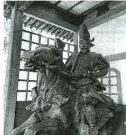
大内義隆像 二人は気が合い、飲むと必ず深夜に

賊に勘合符を奪われたため、ニセ遣明使が仕立てられるのを恐れて早めに派遣と説明したが)などのアクシデントに悩まされますが、同18年北京入城、19年に帰国しました。これが遣隋使に始まる使節派遣の最後でした。