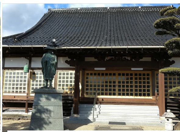
瑞龍山養元寺本堂