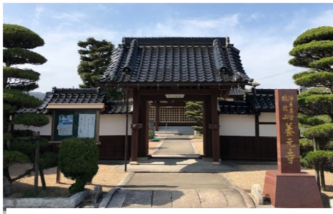
瑞龍山養元寺正門前から

本尊阿弥陀如来と脇仏は朝田の公会堂に祀られている。（大歳史談会 文責：森下茂登喜）