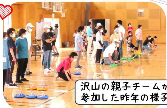
沢山の親子チームが参加した昨年の様子