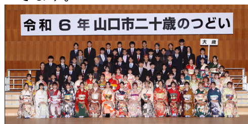
令和6年山口市二十歳のつどい