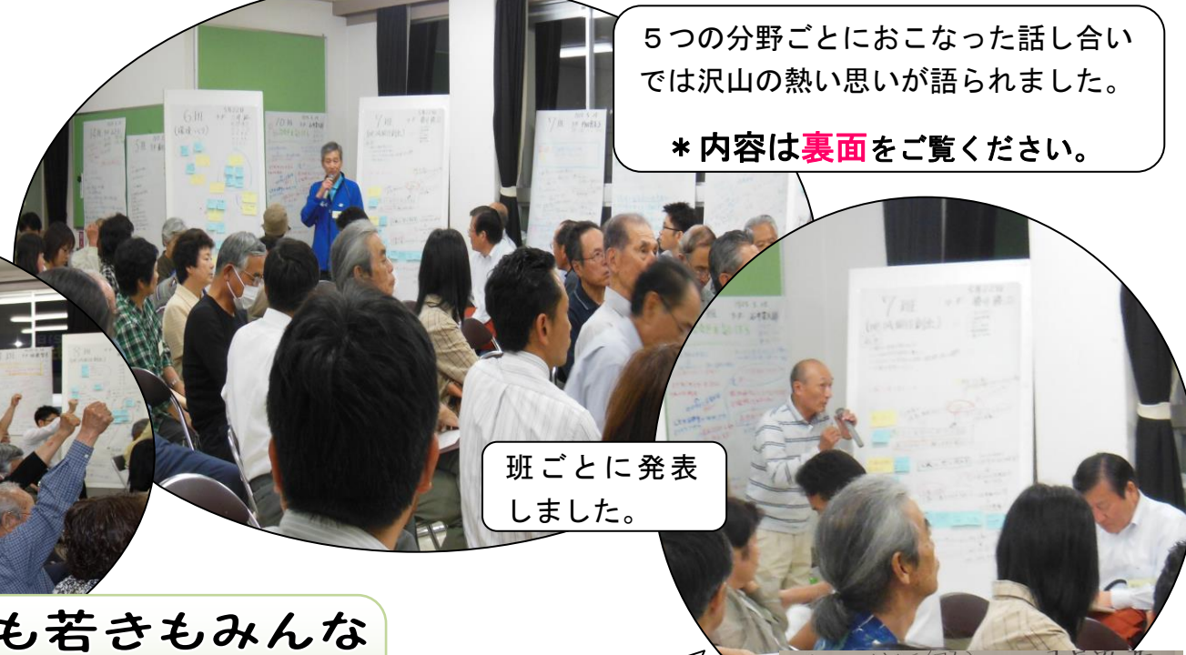
班ごとに発表しました。

5つの分野ごとにおこなった話し合いでは沢山の熱い思いが語られました。 *内容は裏面をご覧ください。