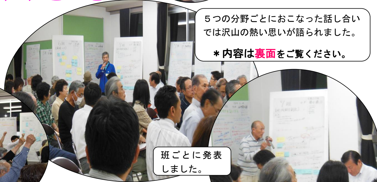
班ごとに発表しました。

5つの分野ごとにおこなった話し合いでは沢山の熱い思いが語られました。 *内容は裏面をご覧ください。