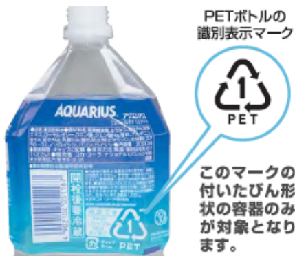
PETボトルの識別表示マーク