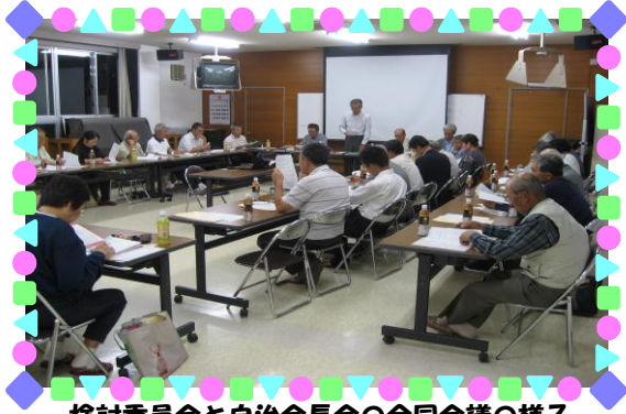
検討委員会と自治会長の合同会議の様子

大歳自治振興会では、昨年の豪雨災害から危機意識をもち、地域のために何かできないかと考え、5月に委員を募集し、自主防災対策検討委員会を設置しました。この委員会で鋭意検討しました提案は、先月14日の理事会で承認を受け、同日各自治会長への説明を行いました。そこで、大歳地区が取り組む防災対策の概要と熱心に協議していただいた委員会の経過についてお知らせします。今後は、自治会等から住民の皆様にご協力要請がありましたら、是非ともご協力いただきますようよろしくお願い申し上げます。