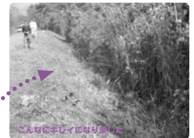
こんなにキレイになりました