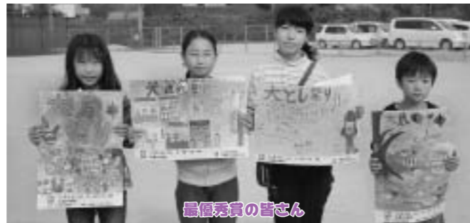
最優秀賞の皆さん

最優秀賞と優秀賞に選ばれたのは次の皆さんです。おめでとうございます。(50音順)