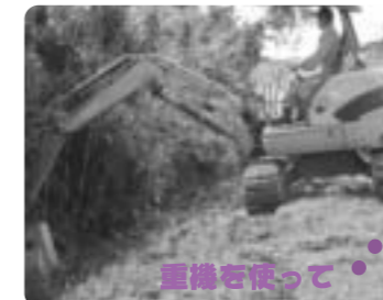
草刈機を使って 吉敷川の土手(三作付近)

見違えるようにキレイになった土手に、不法投棄やポイ捨て等ないように願っています。