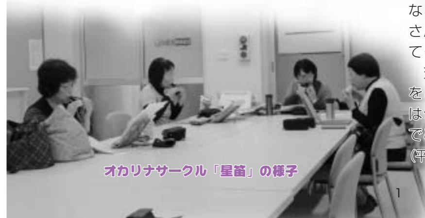
オカリナサークル「星笛」の様子

交流列車おとしをご利用されたい方は☎922-6860までご連絡ください。(平日:9時~16時受付)。