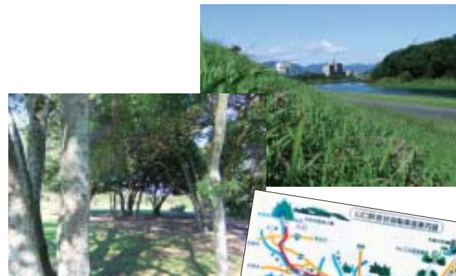
矢原河川公園にある 山口秋吉台自転車道案内図