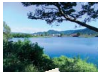
矢原河川公園より 榎野川