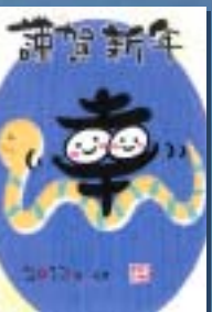
大歳地域交流センター パソコン講座の参加者作品

巳年にちなんで 平成25年は「巳年」です。「巳(み) し」という字は、胎児の形を表した 象形文字で、蛇が冬眠から覚めて 地上にはいだす姿を表しているこ も言われ、「起る、始まる、定まる」 などの意味があり、また、脱皮や生 命力から「復活と再生」「神の使い」 とあがめられています。巳の特徴 は探究心と情熱。平成25年が素晴 らしい年になりますように。