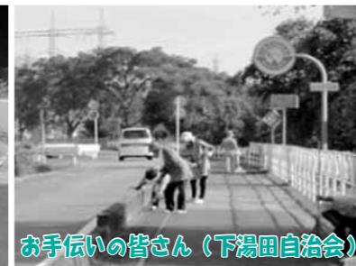
お手伝いの皆さん(下湯田自治会)