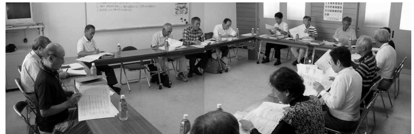
策定委員会の様子

FAX 922-4036 Eメール o104mati@c-able.ne.jp 郵送先 〒753-0861 山口市矢原1407-5 大歳地域交流センター内 大歳自治振興会事務局宛