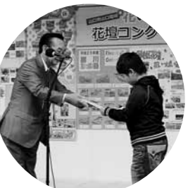
上矢原子ども会の表彰

夏休みの暑い中みんな頑張ったかいたと感想を聞く事ができました。猛暑の中、水やり当番、途中の草引きなど、たずさわった皆さんの日頃の努力が報われました。おめでとうございます。