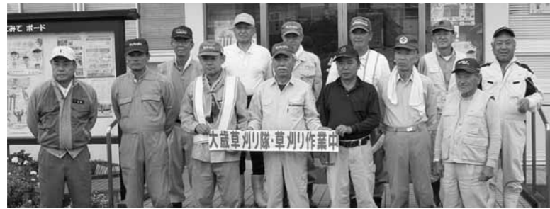
大歳草刈り隊の皆さん

10月20日(日)、大歳草刈り隊の皆さん(16名)による、今年度第2回目の草刈り作業が行われました。今回は、大歳地区一斉清掃日と重なったにもかかわらず、草刈り後のごみ拾いや清掃等のお手伝いに、関係自治会より多くの方にご参加していただき、ありがとうございました。おかげさまで予定時刻より早く終わることができました。