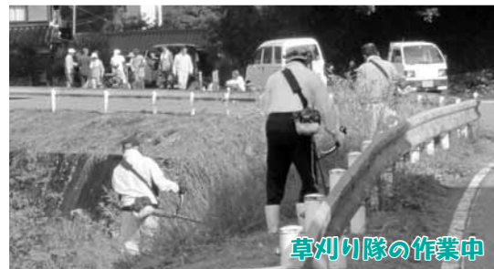
草刈り隊の作業中