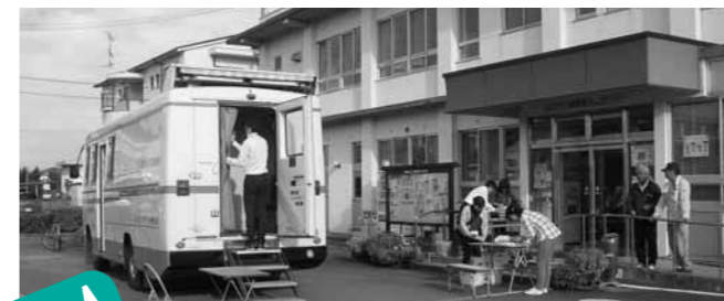
交流センター前での検診の様子

よるPSA検査を受けました。すると再検査の知らせがあり、再度検査したところ前立腺にがんがあると告げられ、転移しているので手術をしても無駄になるとの診察でした。したがって、今は内分泌療法をしておられるのですが、「体内に爆弾を抱いているようなものですよ」と沈痛な表情で話されました。