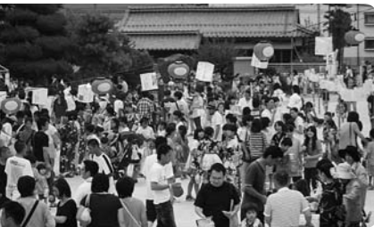
一昨年のおおとし夏まつりの様子