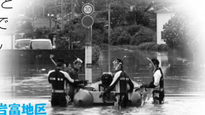
平成27年水害時の岩富地区

少し高台にある私の家の玄関にも水が流れ込んできて、部屋の中に水があふれて畳が浮き上がったりしてどうにもならなくなりました。ちょうどそのとき家の外でマイクで呼ぶ声がしたので、窓から見るとボートで消防署の人が助けに来てくれていました。道路の水は肩の辺りまで溢れていて年寄り一人では逃げることはできませんでしたので思わず手を合わせました。」と当時を思い出して語られました。