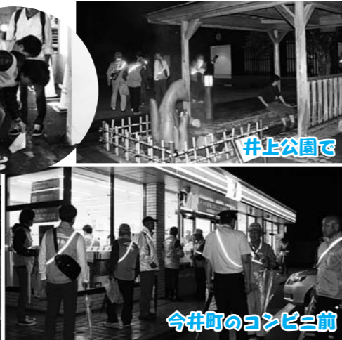
今井町のコンビニ前