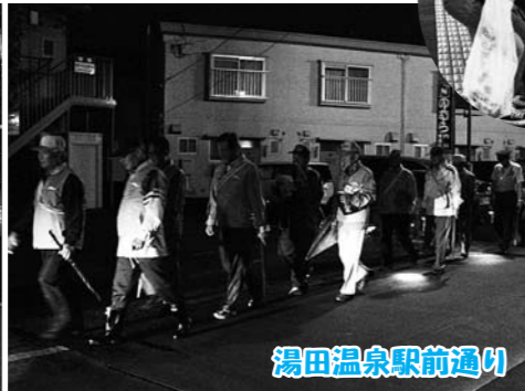
湯田温泉駅前通り