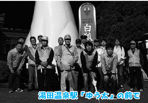
湯田温泉駅「ゆうた」の前で