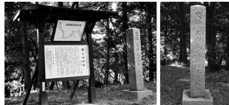
攻防の舞台となった鴻峯城の碑(山口大神宮の裏山)

調べの森は、その政策転換の象徴で、乱に加担した者を探し出しては糾問する場、大内浪人の誇りを奪う場だったと考えられます。天保期の風土注進案には「訛りて、しらめの森と言う」と書かれています。しらめ(白目)を剥かせる厳しい詮議への恐怖を込めた地口だったのかもしれない。