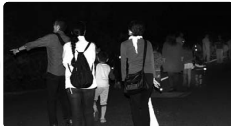
多くの親子づれで賑わいました