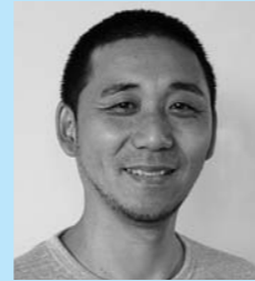
プロフィール 昭和50年生まれ 今年の前厄 平成10年から朝田神社の神主 お子さんは3姉妹 趣味はフットサル

A:このお祭りはボランティアの人をはじめ、地域住民が力を合わせて企画・運営しています。実行委員はもちろん来場者の皆さんもお祭りを盛り上げていただく大切な仲間です。会場に足を運んで頂き、素晴らしい「お祭り」にしていきましょう。よろしくお願いします。