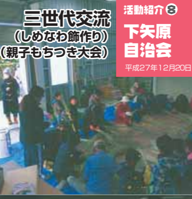
活動紹介⑧ 下矢原自治会 平成27年12月20日