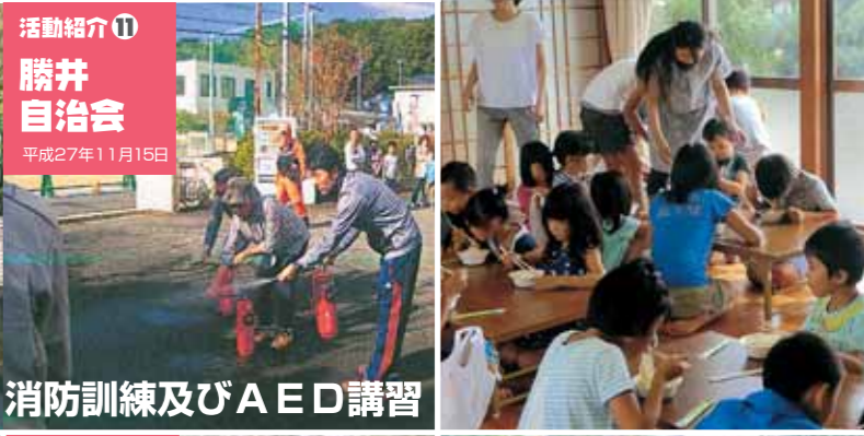
活動紹介⑪ 勝井自治会 平成27年11月15日