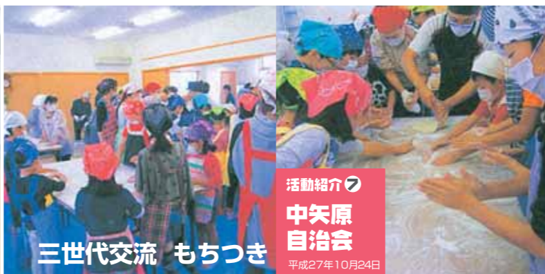
活動紹介⑦ 中矢原自治会 平成27年10月24日