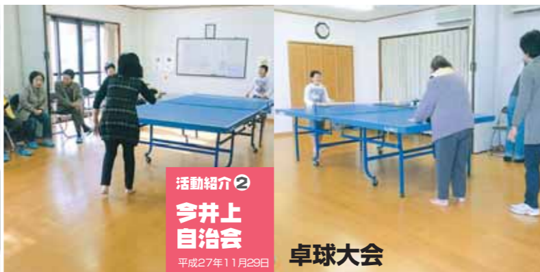
活動紹介② 今井上自治会 平成27年11月29日