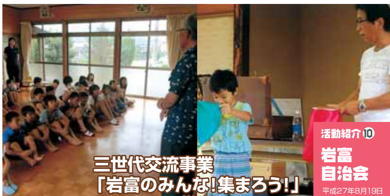
活動紹介⑩ 岩富自治会 平成27年8月19日