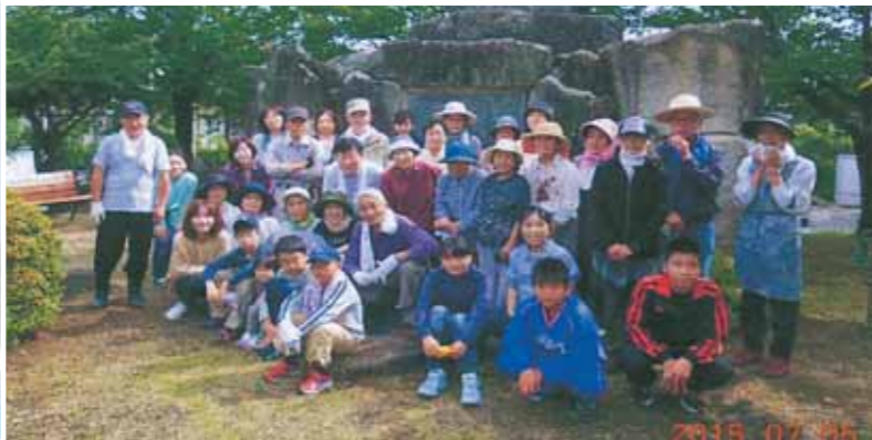
活動紹介④ 上湯田上自治会 平成27年7月5日 9月13日