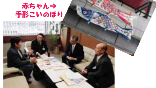
山口市副市長に報告をする様子

これに対し、12月に福島市長さんからお礼状と子供たちの寄せ書きが届き、1月28日には山口市の副市長さんへ報告しました。自治振興会では今後も福島の子どもたちとの笑顔の交流活動に取り組んでいきます。