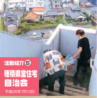
活動紹介⑤ 穂積県営住宅自治会 平成26年7月12日