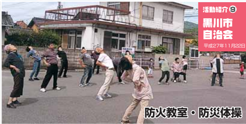
活動紹介⑨ 黒川市自治会 平成27年11月22日