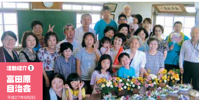
活動紹介① 富田原自治会 平成27年8月2日

「自治会」事業も随分定着してきました。自治会役員にとっては大仕事ですが、お隣同士仲良くなる事が自治会活性化の大前提という単純かつ明快な理念で始まった事業です。お互いの笑顔が親交を深め、知恵をうみだす源泉と信じての取り組みです。今年の事業をまとめて紹介します。