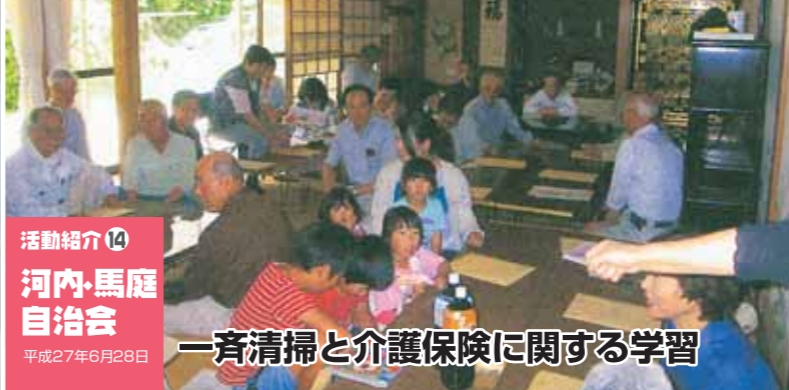
活動紹介⑭ 河内・馬庭自治会 平成27年6月28日