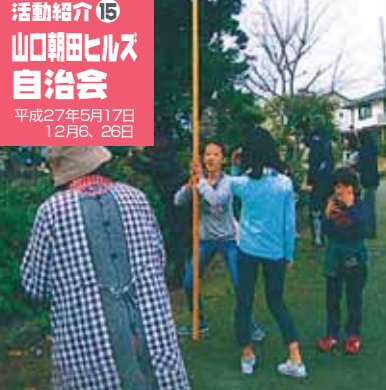
活動紹介⑮ 山口朝田ヒルズ自治会 平成27年5月17日 12月6、26日