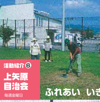
活動紹介⑥ 上矢原自治会 毎週金曜日