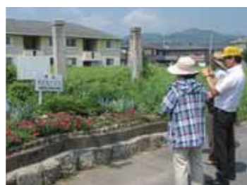
花壇コンクール審査の様子