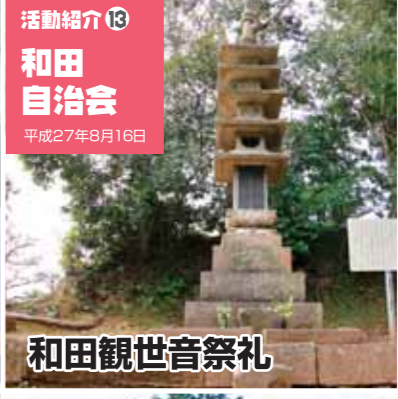
活動紹介⑬ 和田自治会 平成27年8月16日