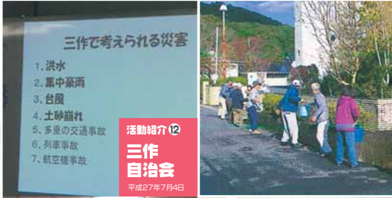
活動紹介⑫ 三作自治会 平成27年7月4日