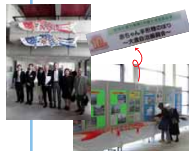
山口市政70周年大会で

当部会においては今年度の活動は主に「高齢者に対する支援」を実施して参りました。その中で高齢者の一人暮らしの方、二人暮らし世帯への災害時の防災用品の一部を配布しての見守り訪問と、「高齢者の居場所、生きがいセンター」について先進地区の3か所を視察研修等を実施してまいりました。計画の中で実施出来なかった事業もあり反省いたしております。地域の皆様との日頃のふれあい、コミュニケーションの大事さを改めて感じております。年々高齢者が増加しており、当部会も重要な位置づけになろうと考えます。健康長寿をめざして「育み、見守る、やさしい大歳」をテーマに、これからも活動して参ります。