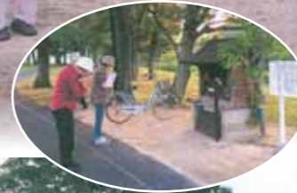
体操の前に馬頭観音にお参りしてから

参加者は50人を越えたり、数人になったり、まさにお天気次第ですが、365日欠かしたことがないのが自慢です。「いつ頃から、誰がいったのやら」あいまいながら、地域の人に愛され続けたラジオ体操会。平成27年度には「やまぐち元氣いきいき大賞」も受賞しました。