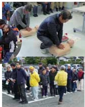
↑交流列車おおとしとワークステーションの合同防災訓練の様子