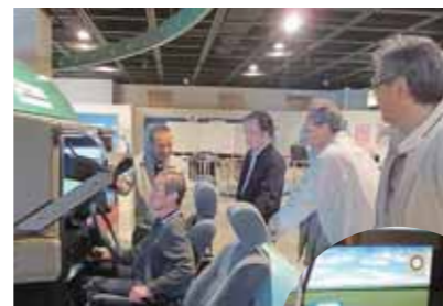
平成28年11月11日 高齢ドライバー1日ドッグ講習の様子(山口県交通安全学習館)