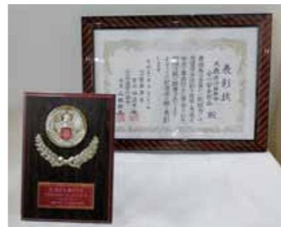
交流センターに置かれている表彰状と楯