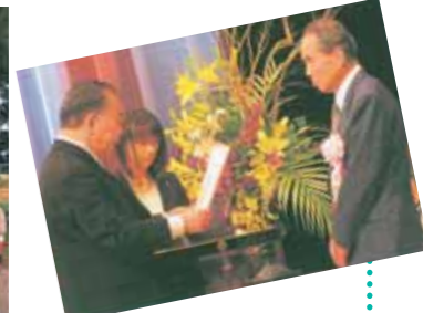
「やまぐち元氣いきいき大賞」授賞式の様子