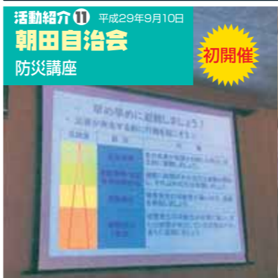
活動紹介⑪ 平成29年9月10日 朝田自治会 防災講座 初開催