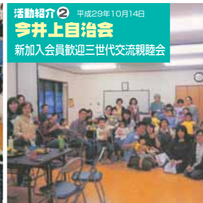
活動紹介② 平成29年10月14日 今井上自治会 新加入会員歓迎三世代交流親睦会