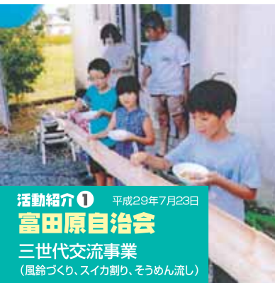
活動紹介① 平成29年7月23日 富田原自治会 三世代交流事業 (風鈴づくり、スイカ割り、そうめん流し)

今年も各自治会の目玉事業の「1自治会1事業」を報告します。 自治会によって工夫された個性のある事業もあります。過去最高の20自治会が事業を行い、 参加者にとっても“楽しむ・学ぶ・役にたつ”ものとなりました。