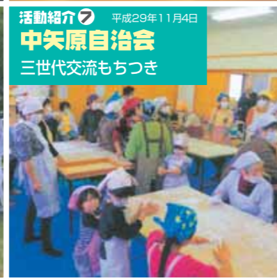
活動紹介⑦ 平成29年11月4日 中矢原自治会 三世代交流もちつき