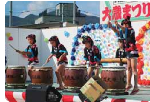
大歳まつりで大歳太鼓保存会の太鼓を演奏する大歳子ども太鼓のみなさん