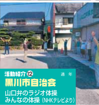
活動紹介⑫ 通年 黒川市自治会 山口弁のラジオ体操 みんなの体操 (NHKテレビより)