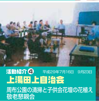
活動紹介④ 平成29年7月16日 9月23日 上湯田上自治会 周布公園の清掃と子供会花壇の花植え 敬老懇親会