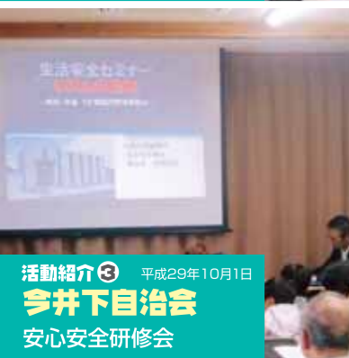
活動紹介③ 平成29年10月11日 今井下自治会 安心安全研修会