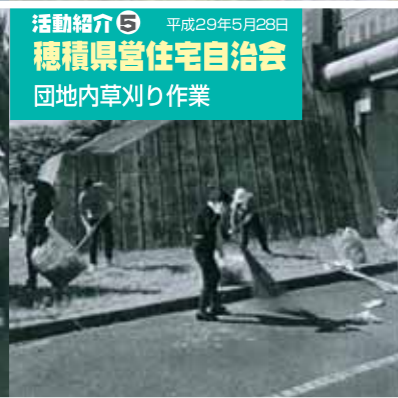
活動紹介⑤ 平成29年5月28日 穂積県営住宅自治会 団地内草刈り作業