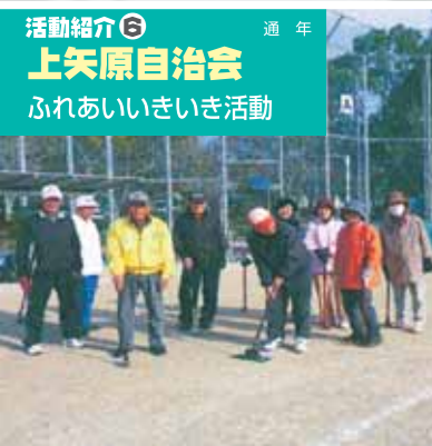
活動紹介⑥ 通年 上矢原自治会 ふれあいいきいき活動