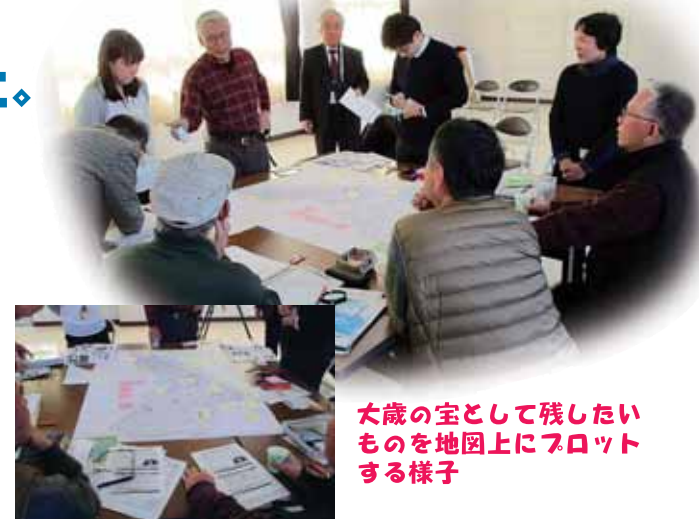
大歳の宝として残したいものを地図上にプロットする様子

2月5日、大雪をものともしない11人の有志のみなさんが集まりワークショップが行われました。2つの班に分かれ、大歳で守っていききたい・未来に残したいお宝を出し合い地図上に記入しました。石垣の家屋や河川改修など水害に挑んだ歴史や、石州街道とともに歩んだ大歳の特色を表す史跡などがまとめられました。今後、市文化財保護課により平成30年度まで調査が行われ、平成31年度に山口市歴史文化基本構想がまとめられる予定です。