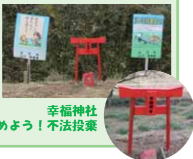
幸福神社 止めよう!不法投棄

来年度も「安全で安心なまちづくり」のために部会員全員で取り組みますので、よろしくお願い致します。