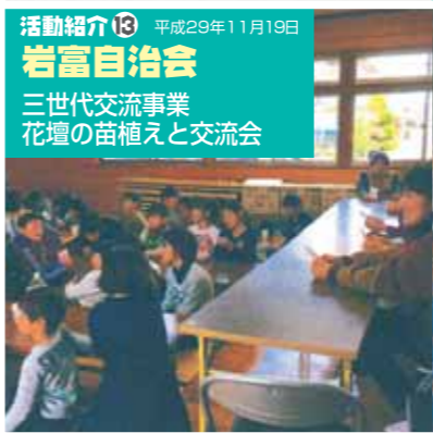
活動紹介⑬ 平成29年11月19日 岩富自治会 三世代交流事業 花壇の苗植えと交流会