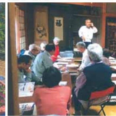
活動紹介⑱ 平成29年10月15日 河内・馬庭自治会 消費生活出前講座