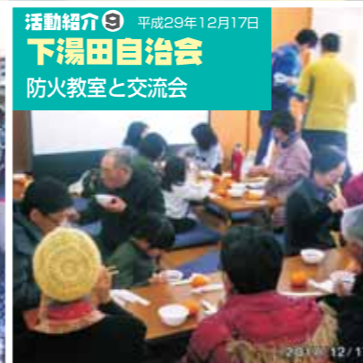
活動紹介⑨ 平成29年12月17日 下湯田自治会 防火教室と交流会