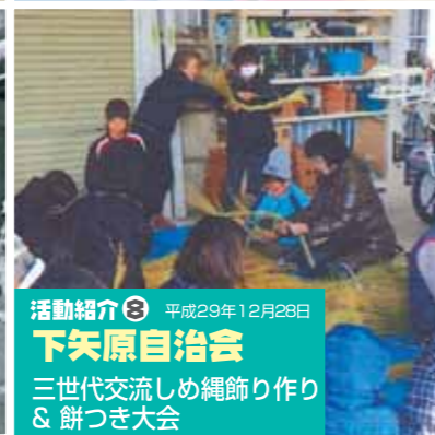
活動紹介⑧ 平成29年12月28日 下矢原自治会 三世代交流しめ縄作り & 餅つき大会