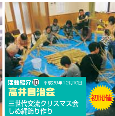
活動紹介⑩ 平成29年12月10日 高井自治会 三世代交流クリスマス会 しめ縄作り 初開催

高井自治会と朝田自治会は、今年度初めて1自治会1事業を行いました。 高井自治会は、三世代交流クリスマス会としめ縄作りを行いました。めった集まることのない三世代が集まり大盛会。これを機会に顔を覚えて道で出たら挨拶することを約束し閉会しました。 朝田自治会は、山口市の防災士・2人の講師を招いて防災講座を開き、日頃から防災意識を持つことの重要性や地域の安心・安全について学びました。