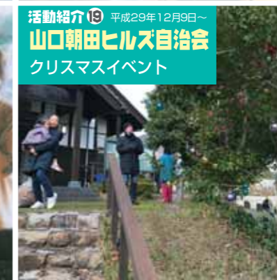
活動紹介⑲ 平成29年12月9日～ 山口朝田ヒルズ自治会 クリスマスイベント