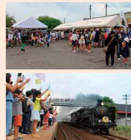
交流列車おとしまつり

9月に開催した、交流列車おとしまつりは300人以上の来場者があり盛會裏に終わることができました。今年も開催をする予定ですので皆様のご来場をお待ちしております。