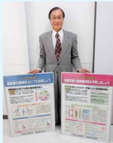
部会で作成したパネル

大歳地域の皆様には大変お世話になっています。大歳で生まれ育った私が、主に高齢者の皆様の健康福祉のお手伝いに関わってまもなく1年が経とうとしています。自らも高齢者となり、いつまで元気で過ごせるかという年齢となった今、人によって寿命は違いますが、生きている内は元気で過ごせたらという思いはあります。私の力不足で今年1年余り皆様のお役に立てていなかったのではないかと危惧しています。今後ともご支援の程よろしくお願い致します。