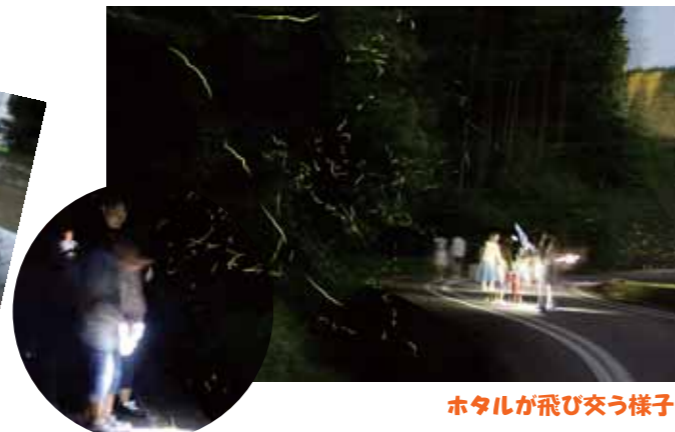
ホテルが飛び交う様子

6月2日(土)に河内地区で行われ、60人の親子が参加してホテルを鑑賞しました。日没からしばらくするとホテルが飛び交い、幻想的な雰囲気に魅了されました。