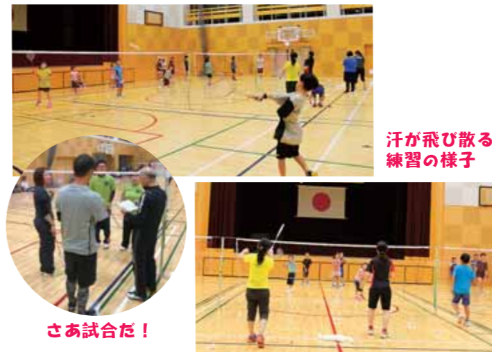
汗が飛び散る練習の様子