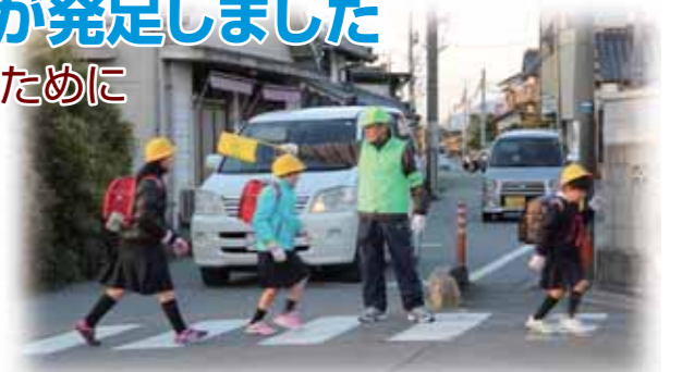
狭い石州街道は危険がいっぱい

大歳小学校前の石州街道は、道路幅と歩道が狭く、事故がいつ起きてもおかしくない状態にあります。大歳自治振興会ではこれまで通学路の交通安全対策協議会において協議を行ってききましたが、6月に歩行者と児童の安全確保を目的に山口市に道路の改善、特に水路のふたかけを要望いたしました。