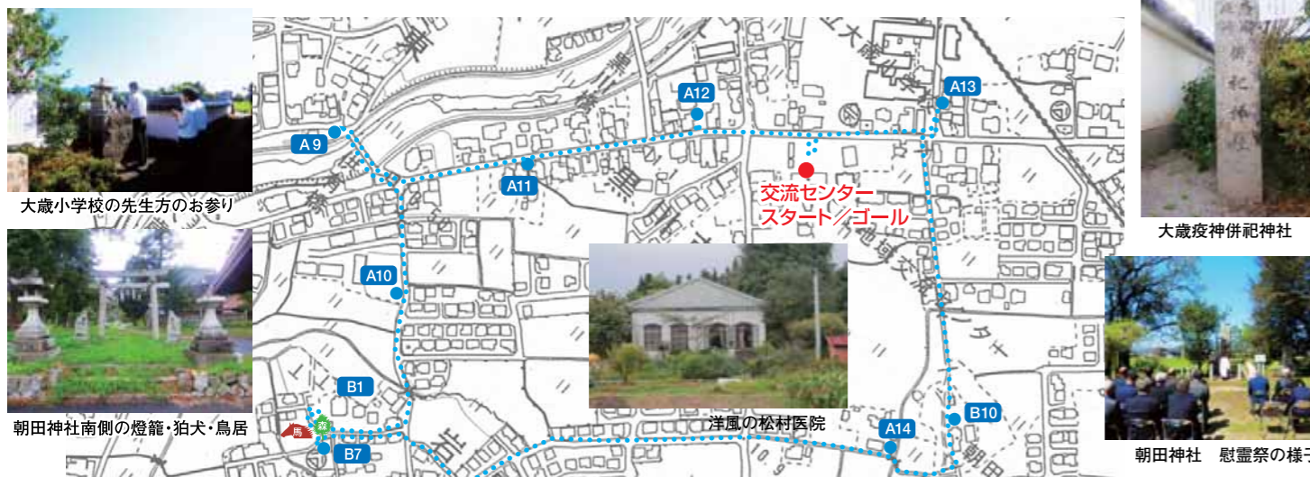
大歳小学校の先生方のお参り

けて参道を北に歩いて行くと市道(旧石州街道)にでます。そして右斜めの道を、北に行くと右側に「大歳様」(A13)あります。この「大歳様」は「農耕の神様」で、大歳の名は、この小字名に由来しています。大歳小学校が増改築するたびに移転し、昭和のはじめに現在地に落ち着きました。また、ここには「大歳疫神併祀神社」と書いた石柱があります。下湯田地区には「疫神元」とい小字名がありますが、おそらくその辺りのあった「疫神様」をここに併祀したのでしょう。朝田神社は11月中旬に「秋まつり」、大歳様は毎月、月初めと月半ばに大歳小学校の先生が御参りをし、また毎年12月1日には、下湯田の人がお参りしています。