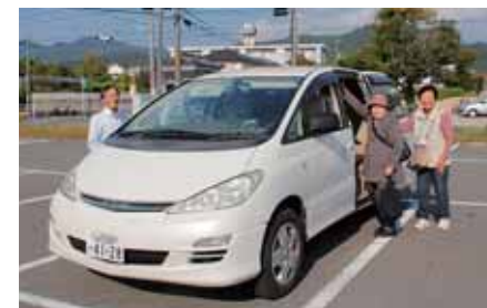
交流センター出発

しかし、高齢者の切実な願いに応えようとするこの支援活動、12月でいったん終了予定ですが、知恵を結集し地区社協や自治振興会の力を借りて、もっと充実させて本格出発してほしいと筆者も願っています。