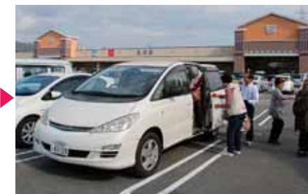
ショッピングセンター到着