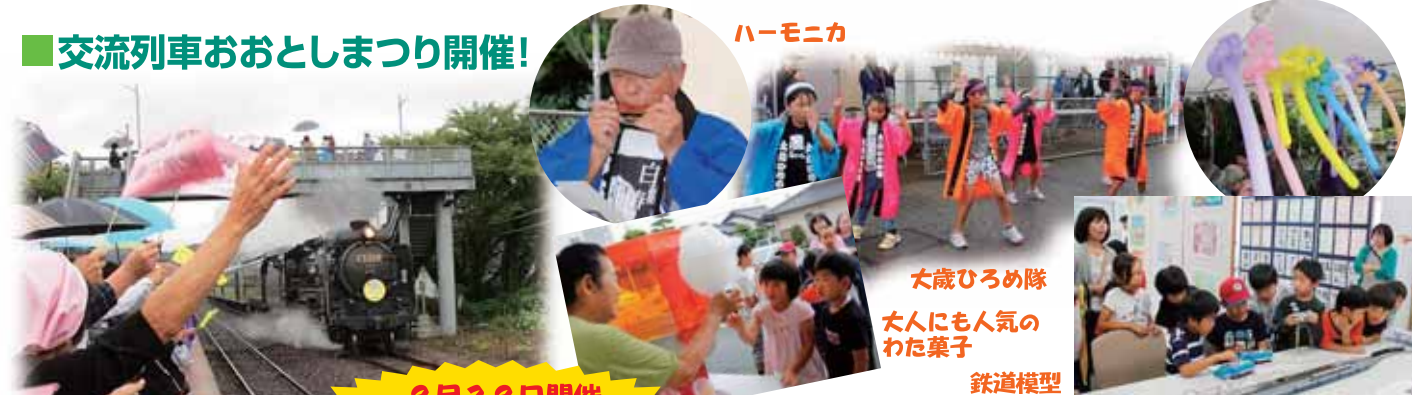
9月29日開催 雨の中たくさんのご来場ありがとうございました