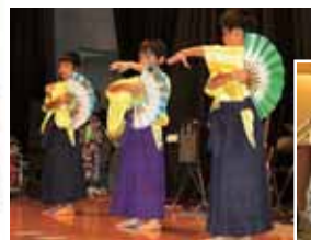
さわやか学級の舞