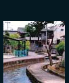
銅賞 「湾曲の大きな水路」 平仲三佐江