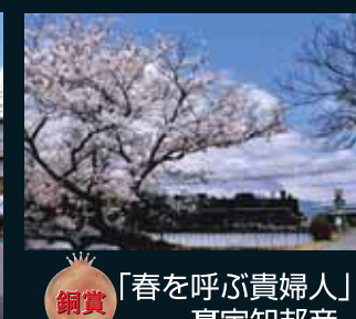
銅賞 「春を呼ぶ貴婦人」 高宇知邦彦