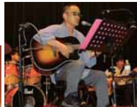
らくやあん鹿野苑バンドの弾き語り法話