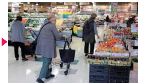
うきうき買い物タイム