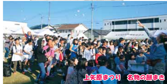
上矢原まつり 名物の餅まき