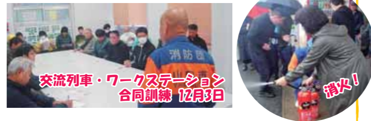
交流列車・ワークステーション 合同訓練 12月3日