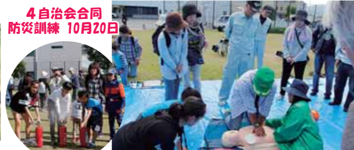
4自治会合同 防災訓練 10月20日