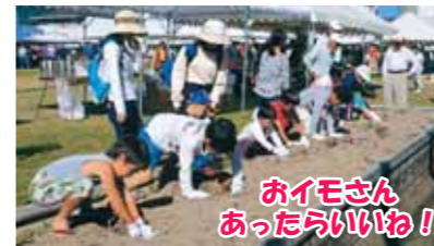
おイモさん あったらいわ!

「ワァー」と子どもたちの歓声があがり、上矢原まつりのメインイベントもちまきが始まりました。2年連続小雨の中で決行されたまつりも今年度は晴天に恵まれ、上矢原第一公園はテントが並び出店もだされ、様々な出しものでにぎわいました。旧