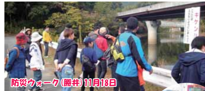
防災ウォーク(勝井)11月18日