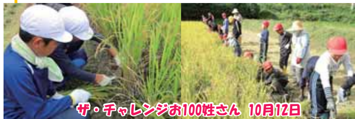
サ・チャレンジお100姓さん 10月12日