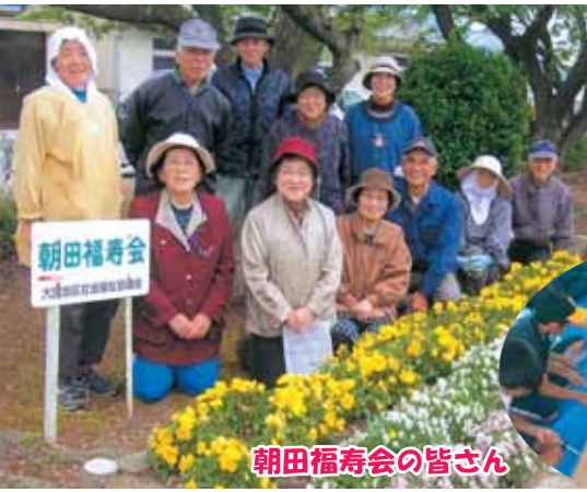
朝田福寿会の皆さん

は「通勤・通学者に大歳駅を気持ちよく利用して欲しい」と言われています。会長の話からは、朝田福寿会のみなさんの「大歳への思いやり」が伝わってきます。朝田福寿会は昨年の11月に、長年の活動に対して、山口県環境生活功労者知事賞（清掃美化優良団体）を受賞しました。