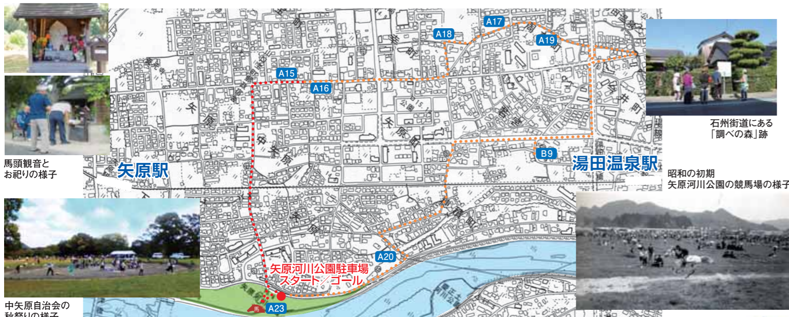
馬頭観音とお祀りの様子

したので、馬頭観音に牛馬の無病や安全を祈願しました。「石州街道」をめざして北に向かい、榎野川の土手を通り抜け、矢原第三踏切を超えてしばらくすると石州街道に出ます。石州街道を右に曲がり、東に行くと「調べの森」(A15)の看板があります。永禄12(1569)年に、大内輝弘(注2)が豊後・大友氏の支援を受け、山口に乱入してきた時に、たくさんの大内浪人が大内輝弘の軍に加担しました。毛利軍は加担者を徹底して弾圧しました。「調べの森」は、その取り調べの場所、拷問の場所といわれています。(注1)冊子「明治維新と大歳」に挿絵があります。(注2)31代当主大内義隆の従兄弟