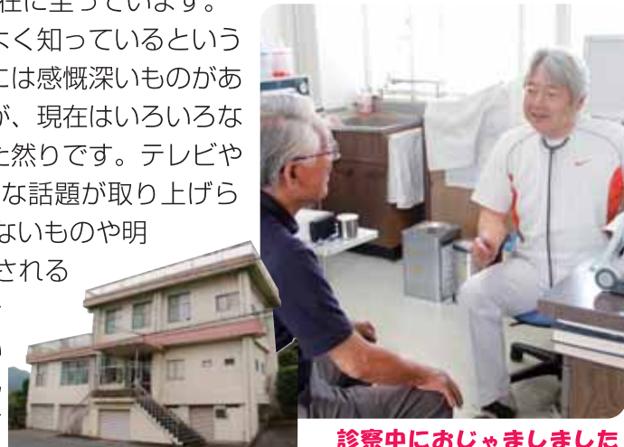
診察中におじゃましました

内科を中心に診療を行っていますが、昔のことをよく知っているという患者さんが、その頃の話をすることもあり、そこには感慨深いものがあります。時代の移り変わりには驚くものがありますが、現在はいろいろな情報に満ち溢れており、病気や医療関係の情報もまた然りです。テレビや雑誌、インターネット等々、毎日のようにいろいろな話題が取り上げられています。しかしながらこれらの多くは、根拠がないものや明らかにおかしいものです。このような情報に振り回されることのないように、診療に際しては、話をよく聞きまた説明をしっかりとする等々、いつも心掛けています。私のできることはほんの少しかもしれませんが、今後皆さんがどのように生きていかれるか、何らかのお役に立てれば幸いかと思っております。