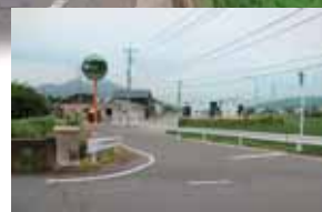
↑大歳駅側から望む