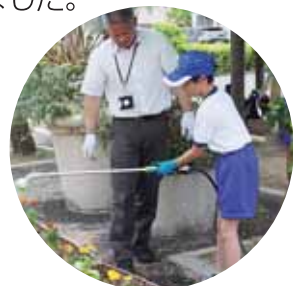
花の苗は総合支援学校の生徒さんが育てたものです。