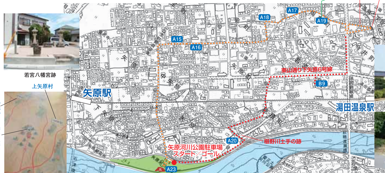
地下上申絵図 (江戸時代)

東コースは最終回に入ります。新しく出来た「東山通り下矢原6号線」を西に約100m行くと、交差点があり、その南側に今井下公会堂があります。その隣に燈籠がある敷地があり、ここが「若宮八幡宮」(B9)の跡地です。この若宮八幡宮は、鎌倉時代の正安元(1299)年、豊前国宇佐八幡宮から勧請されます。洪水で流された歴史もあり、江戸時代に社殿は再建されたと伝わります。この若宮八幡宮は今井・上矢原・中矢原の氏神社であり、1840年代には産子(氏子)58家とあります。明治42(1909)年に祭神が朝田神社に合祀されるまで、この地に鎮座されていました。若宮八幡宮跡地を後にして「6号線」をさらに西にいき、T字路を通りすぎ、その後信号のない2個目の十字路