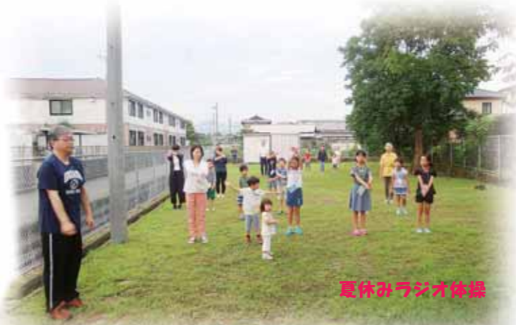
夏休みラジオ体操