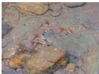
準大賞 ヤバイ...見つけた!