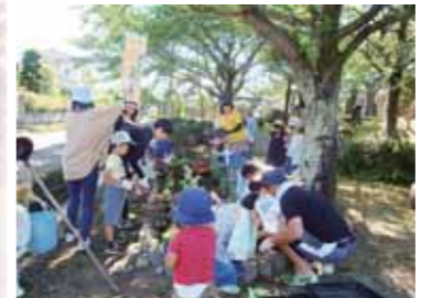
子ども会清掃の様子