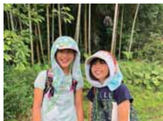
準大賞 ダブル農家娘