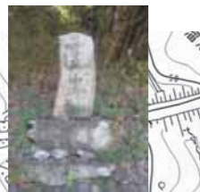
法満寺川の傍の庚申塔