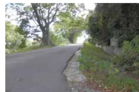
舗装が欠けた路肩