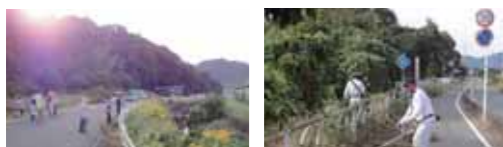
各自治会の清掃活動の様子

10月20日に大歳地区一斉清掃が行われました。自治会や草刈隊のみなさんが、朝早くから清掃活動に汗を流され、地域がきれいになりました。