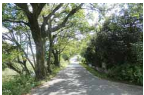
木の枝がかぶさる道路