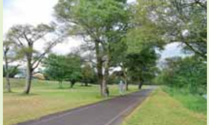
↑山口秋吉台 公園自転車道

大歳地区最大の公園です。敷地内に自転車道が通っており、ランニング等の運動のほか、四季折々の榎野川の自然風景や野鳥の姿が楽しめます。春にはお花見もできますよ。