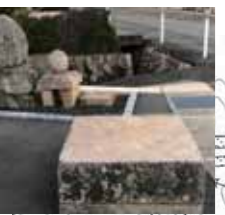
お旅所と猿田彦石碑