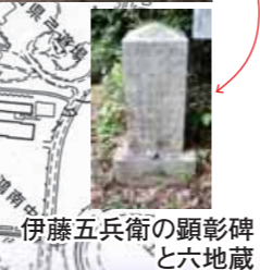
伊藤五兵衛の顕彰碑と六地藏