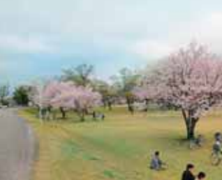
→桜の季節は憩いの場