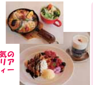
人気のベジカレードリア ワッフルとチーズティー

駐車場は、このビルの駐車場の一番奥10台分です。出店されて2年余り。新しい感覚のこのカフェを覗いてみられませんか。