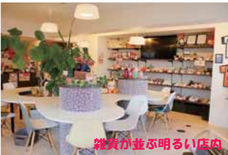
雑貨が並ぶ明るい店内