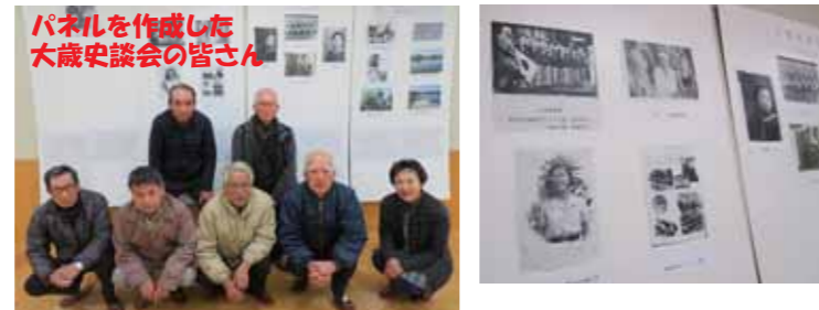
パネルを作成した大歳史談会の皆さん