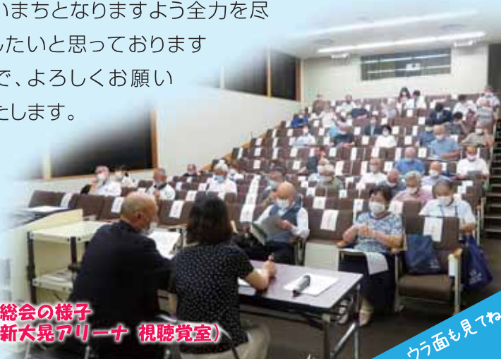
1 臨時総会の様子 (維新大晃アリーナ 視聴覚室)

そのような時期の突然の辞任で、後任人事が思うにまかせない事態をうけ、非才の身ではありますが、会長職を引き受けさせていただくことになりました。皆様のご協力とご支援で大歳が少しでも住みよいまちとなりますよう全力を尽くしたいと思っておりますので、よろしく願いいたします。