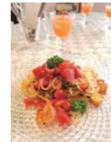
健康と美容の薬膳料理教室

お店のおすすめメニューは、薬膳カレー。ターメリックやジンジャーなど30種類混ぜ合わせた独自のスパイスを使って、体温と代謝を上げ、毒出し(デトックス)をする効果があるとのこと。他にもこのスパイスを使った担々麺や、デザートには台湾かき氷など工夫をこらしたメニューも有ります。