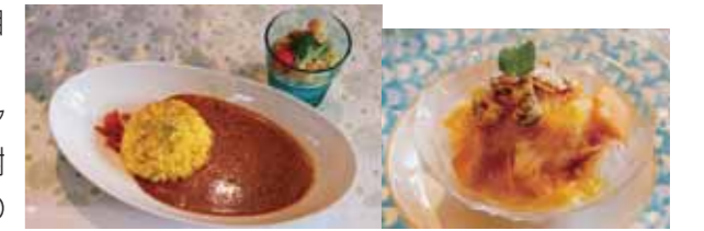
薬膳カレーセット+台湾かき氷 (1,600円税込)

ずっと続いている新型コロナ感染の中、お店を維持していくのは大変で今後の不安も語られましたが、何事にも前向きな姿勢に感動しました。