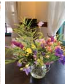
7月から学ぶお花教室

ずっと続いている新型コロナ感染の中、お店を維持していくのは大変で今後の不安も語られましたが、何事にも前向きな姿勢に感動しました。