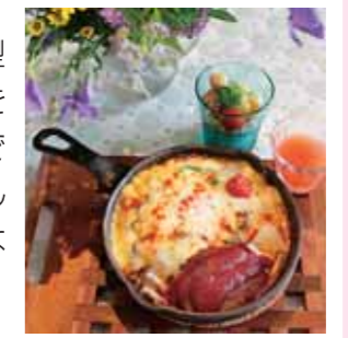
看板メニューの国産牛のハンバーグ入りバイクドカレーセット (1,800円税込)