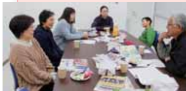
昨年の会議の様子

『まちづくりかわら版おおとし』を一緒につくりましょう。お茶をしながら楽しくご意見を聞かせてください。2月6日(土)午前10時から、大歳地域交流センターで交流カフェを開催します。ご参加くださる方は大歳自治振興会(920-1700)まで。