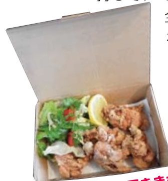
お持ち帰りもできます。

ソースやケーキなどすべて手作りするというシェフの柔和な笑顔の中に料理への自信とこだわりが伝わってきました。ランチやディナーの他、今後もメニューなど工夫・改善していきたいとのこと。楽しみですね。