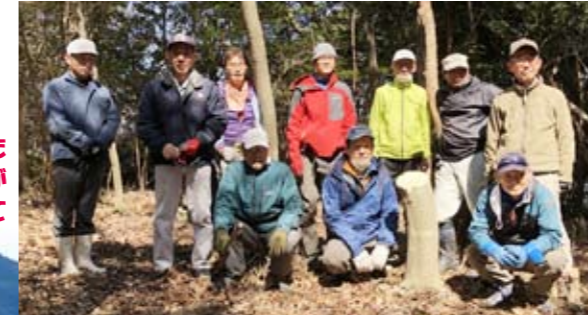
賛同した有志が 金山に登って