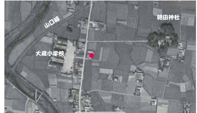
昭和22(1947)年9月23日撮影

大歳公民館は、昭和24年(1949年)に設置されました。この年、社会教育法によって公民館づくりが法制化されました。2年前の平川公民館設立など各地の取り組みが反映された成果でした。