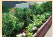
総合支援学校(交流センター花壇)