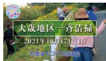
昨年の一斉清掃の様子 (YouTubeにUPしていますので下のQRコードからご覧ください。)