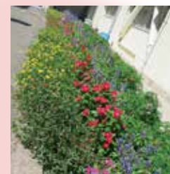
優秀賞 大歳小学校

4年度花壇コンクールには10団体からの応募があり、7月29日(金)9:30から審査をしました。みなさんの花壇はキレイに咲き誇っていました。いつも花壇のお世話をありがとうございます。