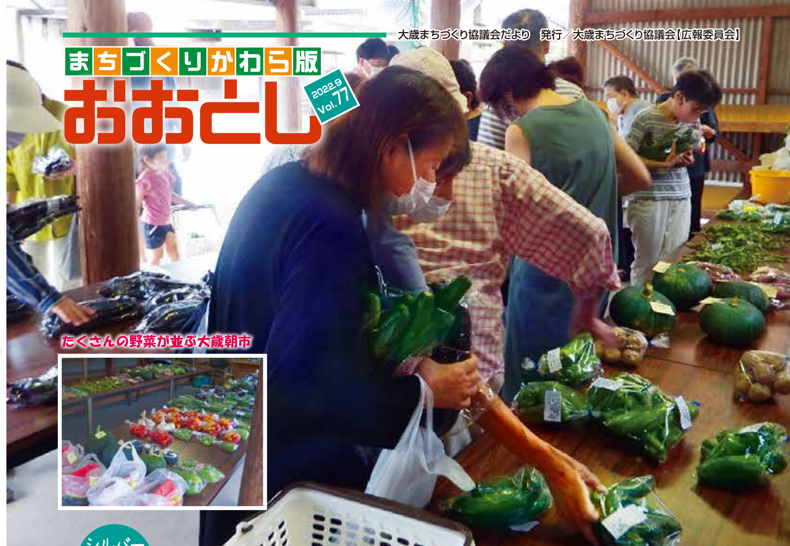
たくさんの野菜が並ぶ大歳朝市