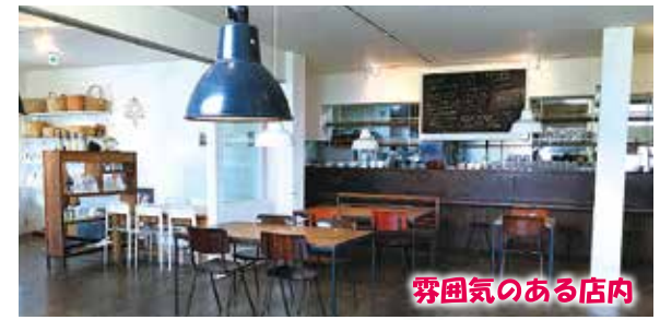
雰囲気のある店内