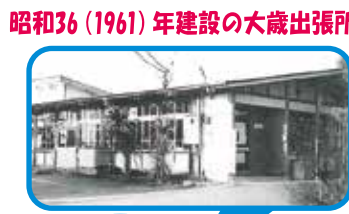
昭和36(1961)年建設の大歳出張所

ところで、公民館は、昭和62年(1987年)に現在の場所へ移りました。それから35年も経つので、公民館が別の場所にあったことを覚えている人も少なくなったのではないのでしょうか。山口では公民館という呼び名も平成21年(2009年)から地域交流センターに変わり、「公民館」という言葉もすっかり聞かなくなりつつあります。