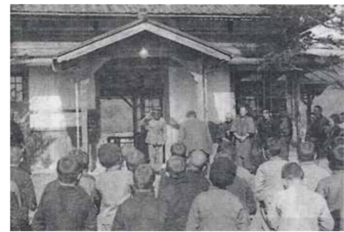
昭和18(1943)年の大歳駅(出征兵士の見送り)

今年の10月14日は、鉄道開業150年の日でした。明治5(1872)年9月12日(太陰暦表示、太陽暦では10月14日)に新橋～横浜間の日本最初の鉄道が開業しました。それから41年後の大正2(1913)年2月20日に小郡～山口間の山口線が開業します。その9年後の大正11(1922)年8月5日