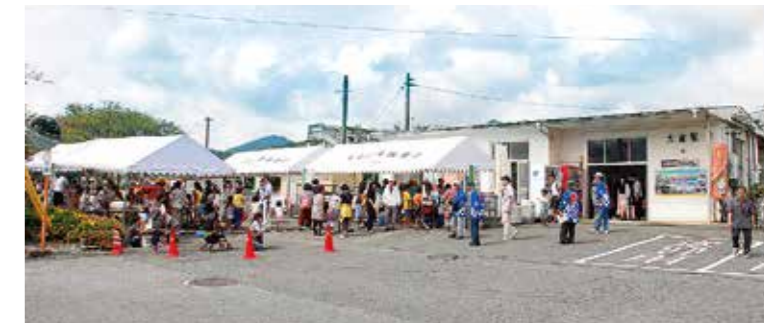
第3回 交流列車おとしまつり 大歳駅

さて、この写真は昭和18(1943)年に撮られた出征兵士を見送っているものです。多くの小学生が見送りに来ているのは、出征したのが教師であったのか、すべての兵士の見送りに地域の小学生が参加させられたのか今となっては分かりません。いずれにしても鉄道の駅で兵士の見送りが盛大に行われたことは理解できます。二度とこんな儀式が行われないことを祈りましょう。