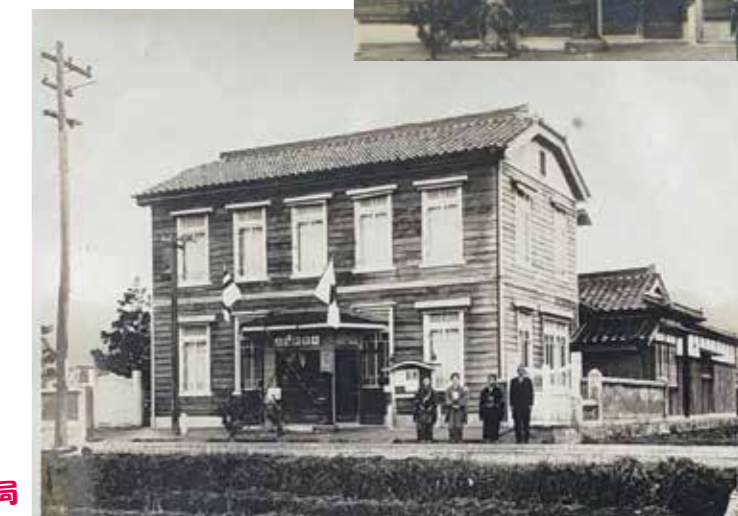
通信インフラの地域拠点としての旧大歳郵便局