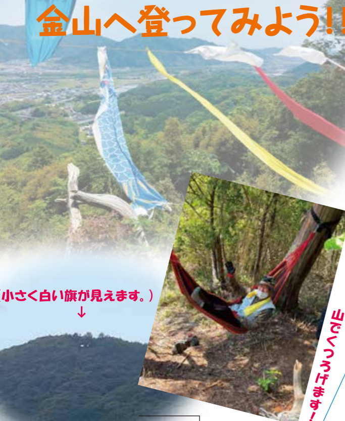
(小さく白い旗が見えます。)