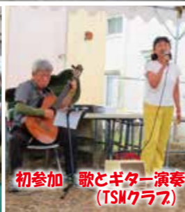
初参加 歌とギター演奏 (TSMクラブ)