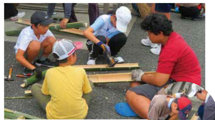
↑竹を割って とうめんを流す 台を作成