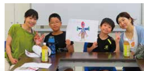
ただ今審査待ちです