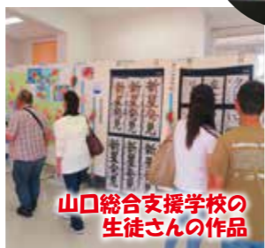
山口総合支援学校の生徒さんの作品