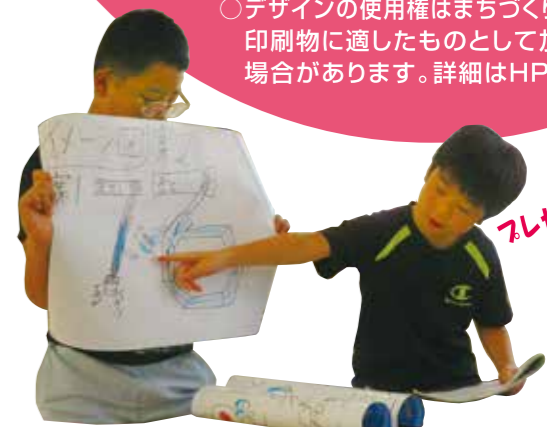
プレゼンテーション中!

子どもたちが「大歳がもっとやさしくもっと元気なまちになるように」と取り組む事業に補助をします。もっとも子どもたちが中心になって行うイベントであっても、おとなの援助や指導が不可欠です。子どもと一緒に楽しもうという素敵なおとなの出番です。ぜひご参加ください。