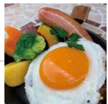
目玉焼とソーセージ添えハンバーグ 1,130円