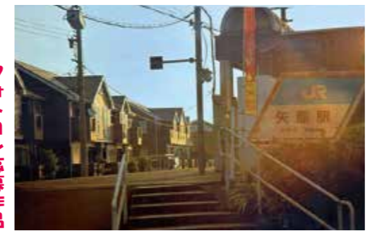
フォトコンテスト作品

さて、今回のテーマである矢原駅の開業はというと、大歳駅の開業から22年後の昭和10年(1935年)です。郷土大歳のあゆみでは、そのいきさつを「平川の中心部に近いところにも駅をとの要望からできた駅」と書かれています。