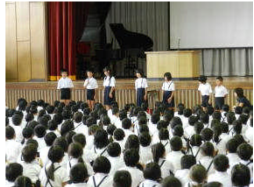
↑ 一人ずつ転入生の自己紹介

始業式翌日から、少しずつ運動会に向けた練習が始まっています。子どもたちにとって、楽しく充実した1日を目指し、まずは運動会モードが続きます。