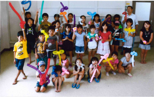
夏休み子ども講座「バルーンアート」