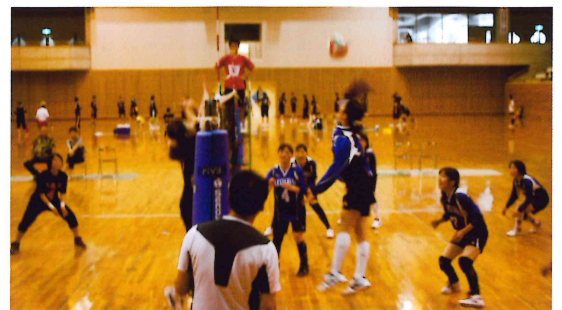
出場された選手の皆さんお疲れ様でした。

男子 優勝 岩 富 分館 準優勝 中矢原 分館 三位 上矢原 分館 女子 優勝 中矢原 分館 準優勝 岩 富 分館 三位 上矢原 分館