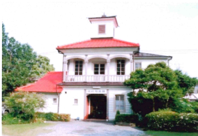
現在、山口市上堅小路103 (八坂神社の南)にある河村写真館