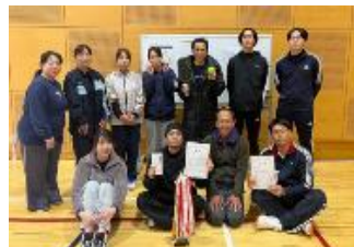
決勝トーナメント