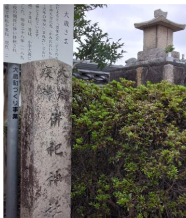
「大歳さま」には疫神も併祀されています

日本の民間信仰には、豊作祈願や疫病退散にまつわるものが数多く存在しますが、疫神を鎮め疫病退散を願うための疫神社もそのひとつです。また、疫神や災厄の侵入を防ぐものとして村境、橋、山道の峠、街道の分かれ道などにおかれたのが道祖神（さえのかみ）です。明治の廃仏毀釈で淫祠（いんし＝民間信仰などの怪しい神）として多くが撤去されましたが、道路改修の際などに移動され改めて石碑やお堂に再建されたものもあります。