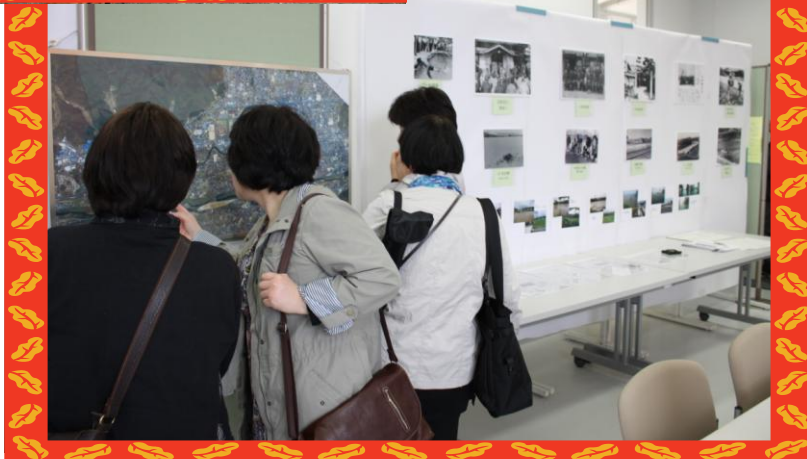
(大歳歴史展：H25年3月31日～4月7日)