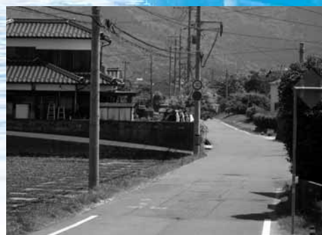
写真:(上)平成21年7月21日の水害(岩窟) (下)平成25年5月24日撮影